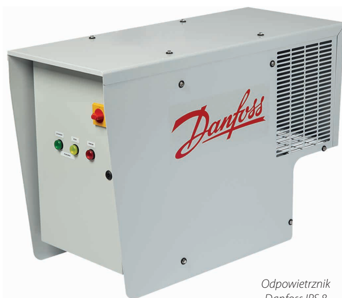
Odpowietrznik Danfoss IPS 8

W systemie autonomicznym, oddzielenie czynnika chłodniczego od NSG odbywa się przez niezależnie działającą jednostkę skraplającą, mającą tylko jeden punkt połączenia z podstawową instalacją chłodniczą. Wynikiem tego jest łatwa instalacja, szybkie uruchomienie, mniejsze ryzyko wycieków wewnętrznych i zewnętrznych oraz znacznie szybsze odessanie czynnika w celach serwisowych.