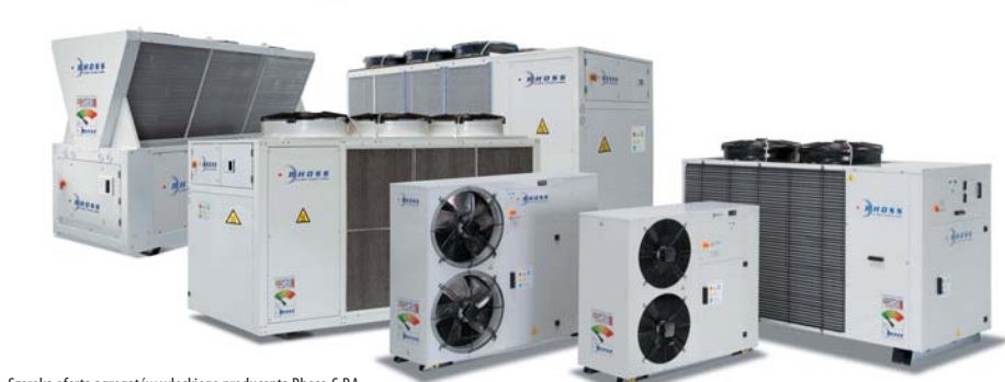
Szeroka oferta agregatów włoskiego producenta Rhoss S.P.A.

Do niewątpliwych zalet chillerów Rhoss należy zaliczyć ich elastyczność ze względu na bardzo szeroki zakres wydajności, mnogość wersji i rozwiązań (chłodzone powietrzem/wodą/ze zdalnym skraplaczem, ciche, bardzo ciche, itp.) oraz naprawdę bogatą ofertę akcesoriów, np. wbudowane moduły hydrauliczne z 1 lub 2 pompami, ze zbiornikiem lub bez, wentylatory sterowane inwerterowo, elektroniczne zawory rozprężne, itp.).