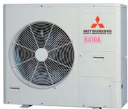
Jedno-wentylatorowa jednostka zewnętrzna VRF KX6 MICRO MHI o mocy 4-6 HP

Rozwiązanie to jest systemem Mini VRF nowej generacji przeznaczonym do małych i średnich obiektów komercyjnych. Układ ten oparty jest na agregatach zewnętrznych wyposażonych w jeden wentylator. Takie rozwiązanie techniczne jednostek zewnętrznych pozwoliło na redukcję przestrzeni zajmowanej przez agregat oraz jego wagi o 35% (w stosunku do poprzedniego systemu MHI KX4).