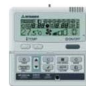
Sterownik przewodowy MHI typu RC-E3

Jednostki wewnętrzne sterowane mogą być zarówno pilotami bezprzewodowymi jak i ściennymi sterownikami przewodowymi typu RC-E3 (rozwiązanie preferowane ze względu na funkcjonalność oraz możliwości użytkowe).