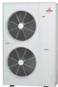
Dwu-wentylatorowa jednostka zewnętrzna VRF KX6 MICRO MHI o mocy 8-12 HP

Rozwiązanie to jest systemem VRF przeznaczonym do średnich obiektów komercyjnych.