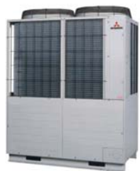
Jednostka zewnętrzna VRF KX6 MHI o mocy 12-24 HP

Rozwiązanie to jest klasycznym systemem VRF przeznaczonym do średnich i dużych obiektów komercyjnych.